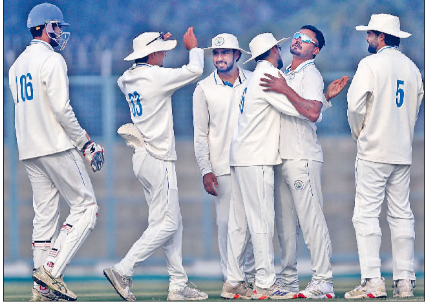
रोहताक। विकेट लेने के बाद खुशी मनाते खिलाड़ी।