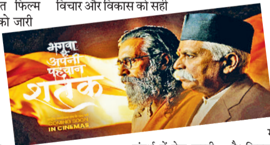
संदर्भ में पेश करती है। इसमें स्वतंत्रता संग्राम में आरएसएस का योगदान, विभिन्न समय पर लगे प्रतिबंध और आपातकाल जैसे महत्वपूर्ण विषयों की झलक भी दिखाई देती है। हाल ही में दिल्ली के केशव कुंज स्थित आरएसएस कार्यालय में फिल्म का गीत ‘भगवा है अपनी पहचान’