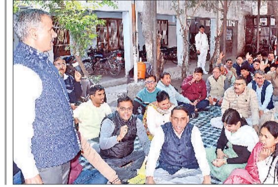
रोहतक। गिरदावरी कार्य में कथित अनियमितताओं के आरोप में 6 पटवारियों को निलंबित किए जाने के विरोध में शुक्रवार को राज्य कार्यकारिणी के दिशा-निर्देशानुसार जिला पटवार भवन में सभी पटवारियों व कानूनों के संकेतिक धरना दिया। एसोसिएशन के पदाधिकारियों ने बताया कि पिछले दिनों 6 पटवारियों को गलत तरीके से सरपेंड कर दिया था।

रोहतक। गिरदावरी कार्य में कथित अनियमितताओं के आरोप में 6 पटवारियों को निलंबित किए जाने के विरोध में शुक्रवार को राज्य कार्यकारिणी के दिशा-निर्देशानुसार जिला पटवार भवन में सभी पटवारियों व कानूनों के संकेतिक धरना दिया। एसोसिएशन के पदाधिकारियों ने बताया कि पिछले दिनों 6 पटवारियों को गलत तरीके से सरपेंड कर दिया था। इस संबंध में राज्य कार्यकारिणी ने सरकार से मिलकर अपना पक्ष रखने और निलंबन वापस लेने की मांग की थी, लेकिन सरकार की ओर से न तो बातचीत का समय दिया गया और न ही साधियों को बहाल किया गया। उन्होंने कहा कि 1 फरवरी तक निलंबित पटवारियों को बहाल नहीं होती है और एसोसिएशन को बातचीत का समय नहीं मिलता, तो आंदोलन तेज किया जाएगा। राज्य कार्यकारिणी के आदेशानुसार 2 फरवरी से अगले तीन दिन तक पूरे हरियाणा में संकेतिक धरना दिया जाएगा।