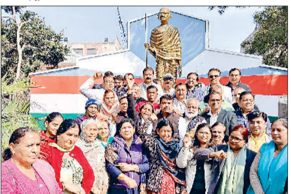
रोहताक। बापू पार्क में महात्मा गांधी की प्रतिमा पर पुष्प अर्पित करते कांग्रेसी।

सत्य, अहिंसा और भाईचारे के आदर्शों व उच्च नैतिक मूल्यों के लिए अपना सर्वस्व बलिदान करने वाले राष्ट्रपिता महात्मा गांधी की पुण्यतिथि के अवसर पर स्थानीय बापू पार्क में कांग्रेस की ओर से श्रद्धांजलि कार्यक्रम का आयोजन किया गया। इस दौरान गांधी की प्रतिमा पर पुष्प अर्पित कर उन्हें